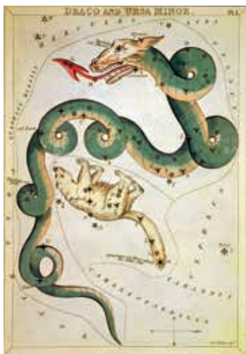
Constellation du dragon et de la Petite ourse