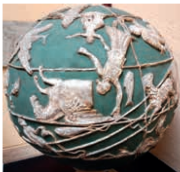
Sphère céleste romaine

Puis, avec l'invention de l'électricité, nous avons perdu de vue la nuit familière vers laquelle nous ne levons plus guère les yeux. Comment reprendre contact avec des millénaires d'expérience de la nuit étoilée ? Comment retrouver le cosmos ?